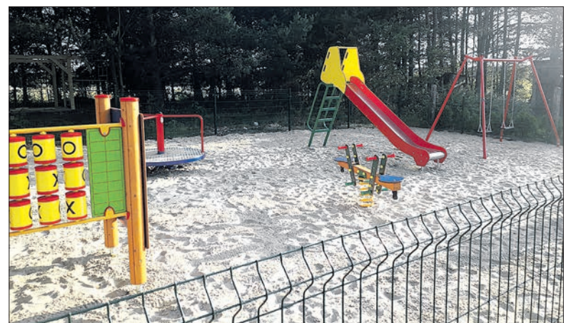
W Tarnowej pojawił się plac zabaw

ne zostało także wyposażenie do świetlicy OSP. Na te zadania poddębicki samorząd przeznaczył 20 tys. zł.