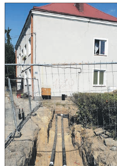
Podłączenie geotermalnego ciepła do bloku na ul. Targowej 2

Sam węzeł składa się z trzech płytowych wymienników ciepła, z których ciepło będzie rozdzielane niezależnie na potrzeby centralnego ogrzewania, ciepła technologicznego zasilającego nagrzew-