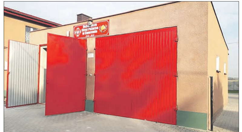
Nowe drzwi zamontowano w garażu OSP Sworawa