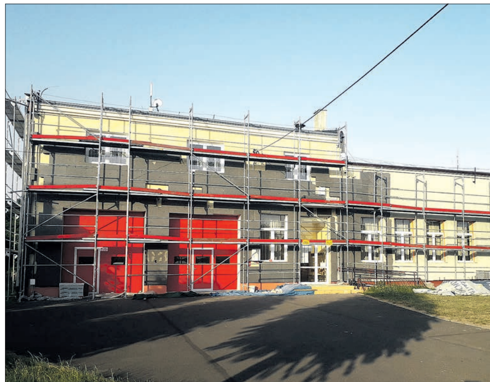
Termomodernizowany budynek remizy w Niewieszu

Obiekt stanowi nie tylko miejsce spotkań mieszkańców Niewieszu. Znajduje się tu również siedziba OSP oraz aktywnie działającego we wsi