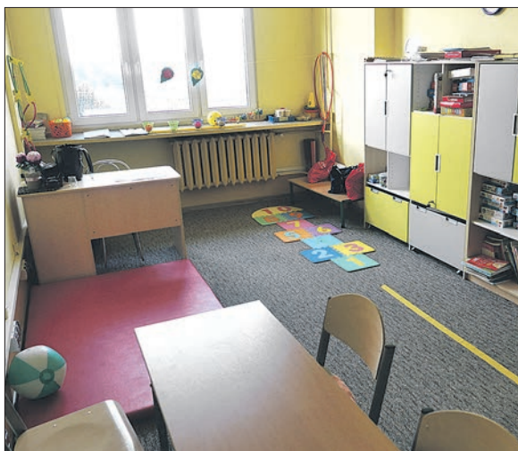
Salę do zajęć rewalidacyjnych w poddębickiej podstawówce

W jednej z sal zamontowano profesjonalną kabinę SI, czyli sprzęt służący do terapii zaburzeń sensorycznych, w szczególności nieprawidłowej aktywności ruchowej. Takiej sali nie ma w żadnej ze szkół na terenie naszego Powiatu.