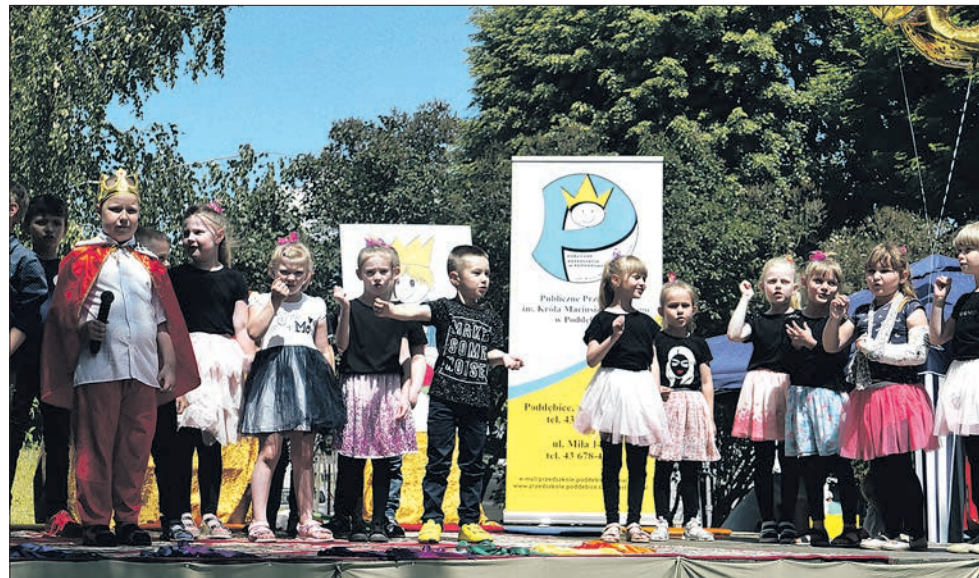
Uroczystość uświetnił występ 6-latków z Królem Maciusiem Pierwszym