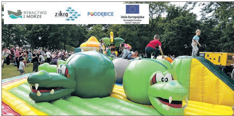
Dzieci chętnie korzystały z przygotowanych atrakcji

Piękna pogoda sprawiła, że maluchy wspólnie z rodzicami licznie uczestniczyli w uroczystościach z okazji Dnia Dziecka przygotowanych na terenie naszej Gminy, a organizatorzy cieszyli się z frekwencji.