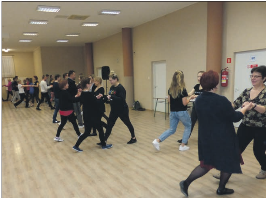
W ramach grantów Stowarzyszenie Przyjaciół Bałdzychowa zorganizowało warsztaty tańca towarzyskiego

tobiorców podpisało umowy na realizację zadań w ramach projektu grantowego o tematyce „Wzmocnienie kapitału społecznego mieszkańców LGD”.