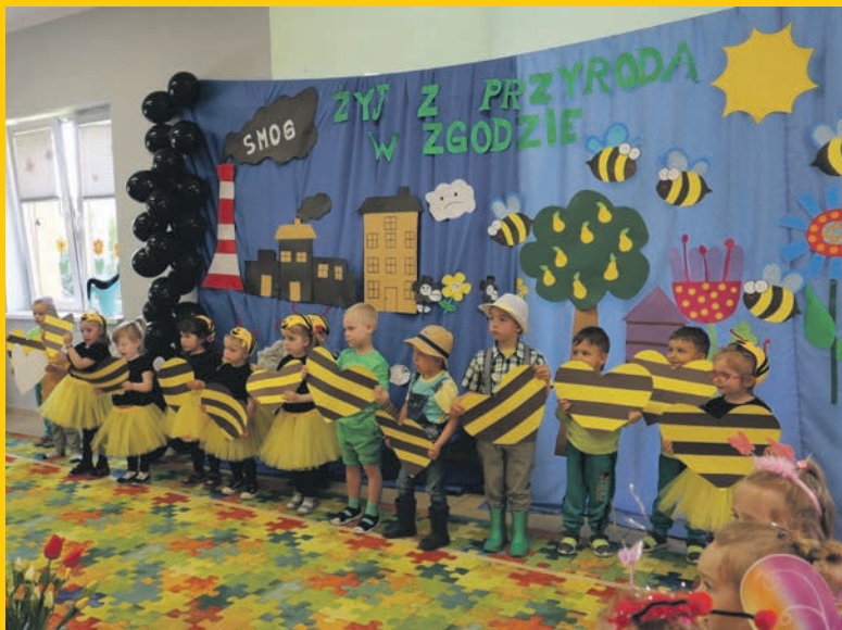
Dzieci z Niepublicznego Przedszkola i Żłobka „Inna Bajka” wystąpiły w przedstawieniu dotyczącym ochrony środowiska i ochrony pszczół