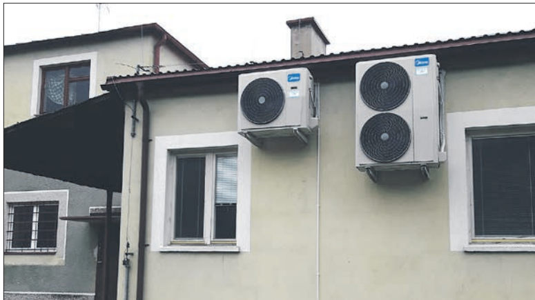
Remiza w Niemysłowie została wyposażona w klimatyzatory

W Sworawie, gdzie ochotnicy są równie aktywni, jak ich koledzy z pozostałych straży, wyremontowano garaż i zamontowano nowe drzwi. Zakupio-