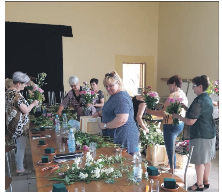
a Stowarzyszenie Promocji Niewiesza i Okolic warsztaty florystyczne