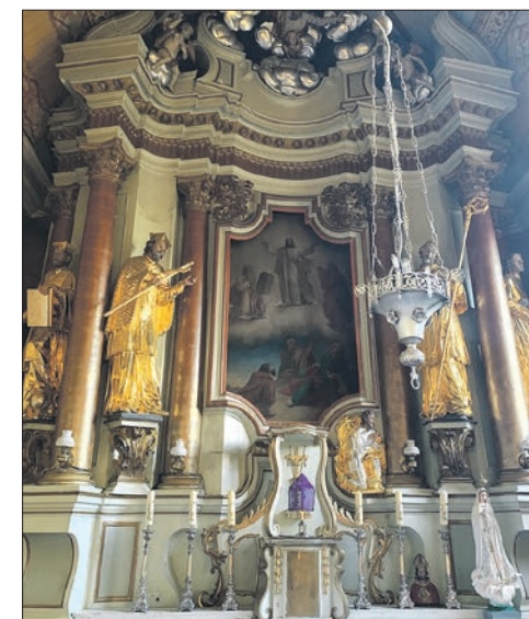
Zabytkowe rzeźby odnowiono dzięki dotacji poddębickiego samorządu

Przypomnijmy, że w 2011 roku poddębicki samorząd dofinansował prace remontowo-konserwatorskie związane z wymianą dachu kościoła w Kałowie. Blaszane pokrycie zastąpiły drewniane belki. Odnowione zostały także ściany zewnętrzne świątyni.