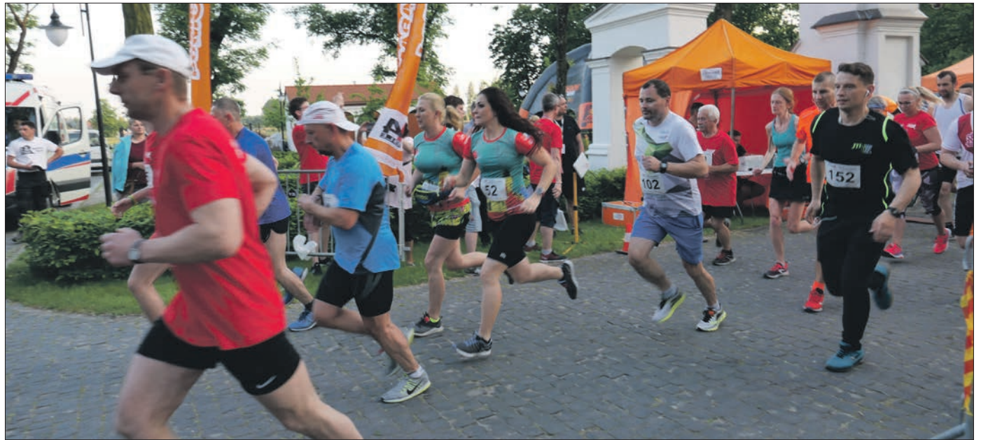
W tegorocznym biegu głównym wzięło udział ponad 150 osób

Nagrodzona została też najlepsza trójka kobiet i mężczyzn – mieszkańców Gminy Poddębice, a także drużyno-wo: Klub Zdyszani.pl, zespół JTI Polska i uczniowie LO Poddębice.