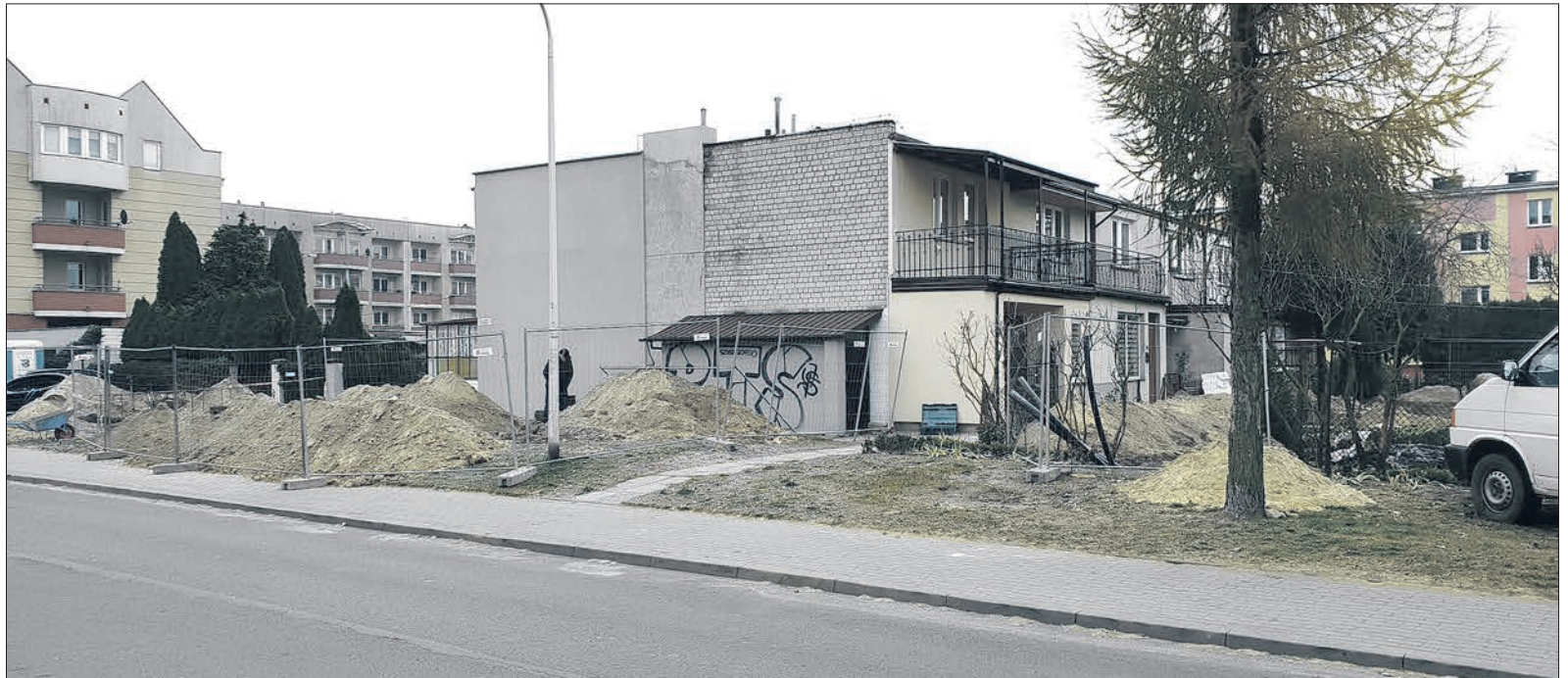
Mieszkańcy szeregowców z ul. Dojazd zostali kolejnymi odbiorcami ciepła z sieci geotermalnej

– Po kilku spotkaniach z mieszkańcami opracowaliśmy dokumentację