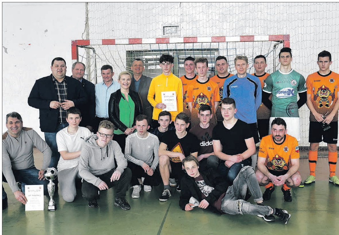
Zwycięzcy tegorocznego halowego turnieju - OSP Poddębice

Po raz dziesiąty strażacy ochotnicy z terenu Gminy Poddębice zagrali w Halowym Turnieju Piłki Nożnej. Na starcie zawodów stanęło sześć drużyn, które walczyły o Puchar Burmistrza Poddębic.