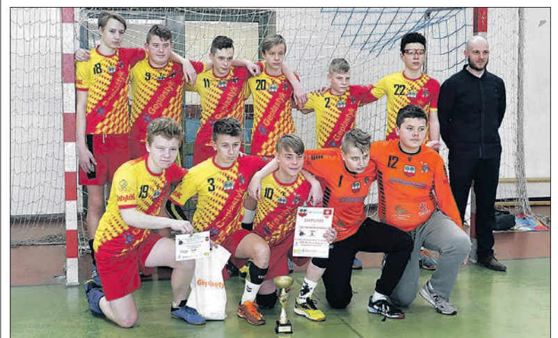
Drużyna UKS Tropcsa rocznik 2004