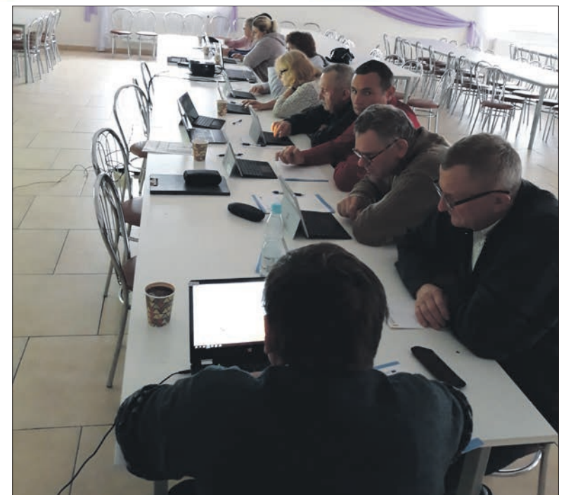
Do tej pory szkolenia odbyły się w Byczynie, Niewieszu, Niemysłowie, Poddębicach, Bałdzychowie i Klementowie