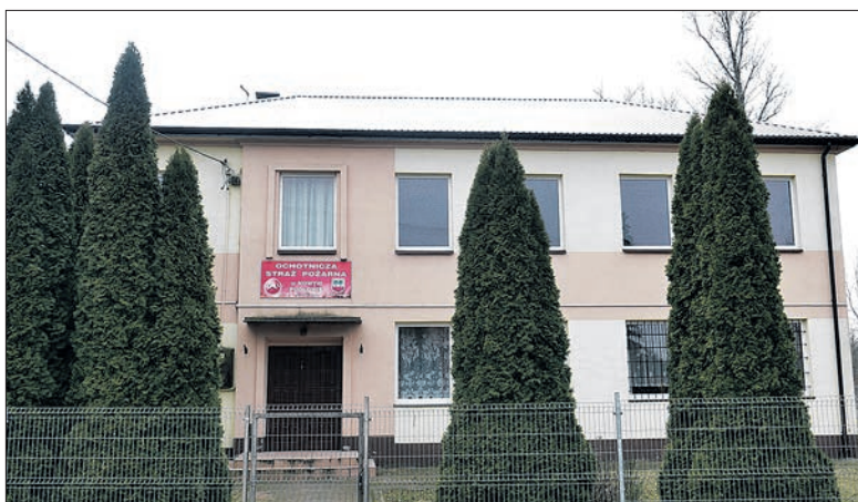
W Nowym Pudłowie wymieniono dach budynku OSP