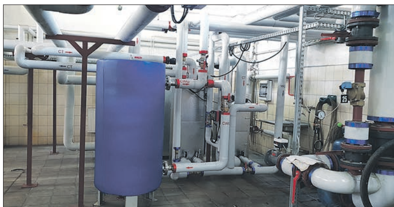
Grupowy węzeł c.w.u. w kotłowni szczytowo-rezerwowej przy ul. Cichej 4

Zaczęło się od zużytego zasobnika ciepłej wody użytkowej o pojemności 5 tys. litrów w kotłowni Cicha 4, który po kilkunastu latach eksploatacji na skutek korozji i perforacji płaszcza zbiornika nie nadawał się do dalszego użytkowania. Zarząd Geotermii podjął decyzję, że w ramach modernizacji nie tylko wymieniony zostanie zbiornik, ale również zamontowany będzie nowy węzeł w układzie szeregowo-równoległym, który w pierwszej kolejności podgrzewał będzie ciepłą wodę, wodą powrotną z centralnego ogrzewania, a dopiero w momencie dużych rozbiorów, gdy temperatura będzie niewystarczająca dodatkowo włączy się drugi stopień