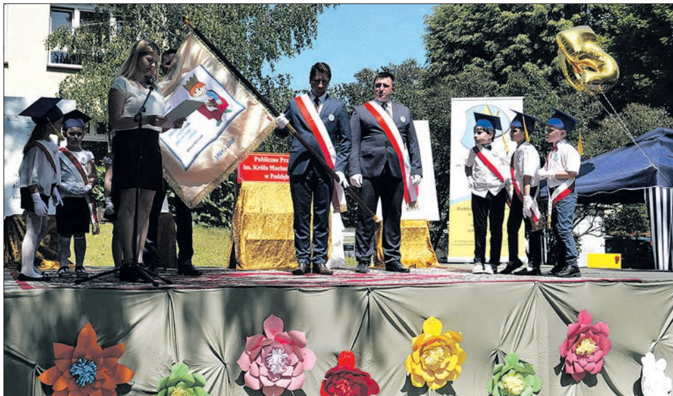
Z okazji jubileuszu przedszkole otrzymało sztandar

Publiczne Przedszkole w Poddebicach świętowało 50-lecie istnienia. Uroczystość była okazją do nadania imienia Króla Maciusia Pierwszego. Placówka może pochwalić się również hymnem i sztandarem.