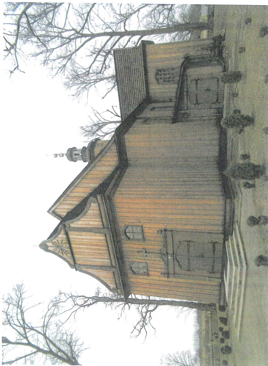
Fot. 1. Kałów, woj. łódzkie. Kościół pw. św Mikołaja Biskupa i św. Stanisława Biskupa. Widok ogólny kościoła.