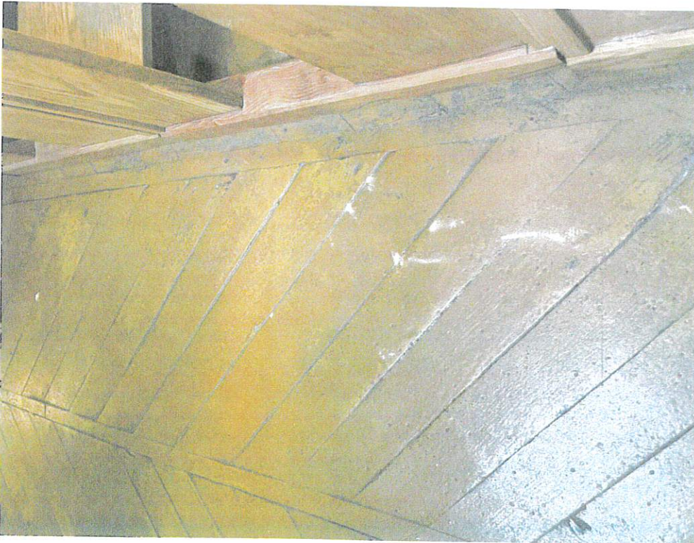
Fot. 6. Kałów, woj. łódzkie. Kościół pw. św. Mikołaja Biskupa i św. Stanisława Biskupa. Widoczny pył drzewny świadczący o obecności drewnojadów.