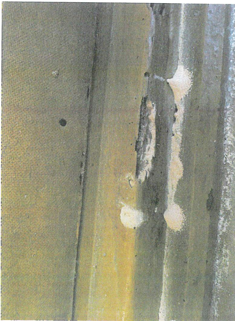
Fot. 4. Katow, woj. łódzkie. Kościół pw. św. Mikołaja Biskupa i św. Stanisława Biskupa. Widoczny pył drzewny świadczący o obecności drewnojadów.