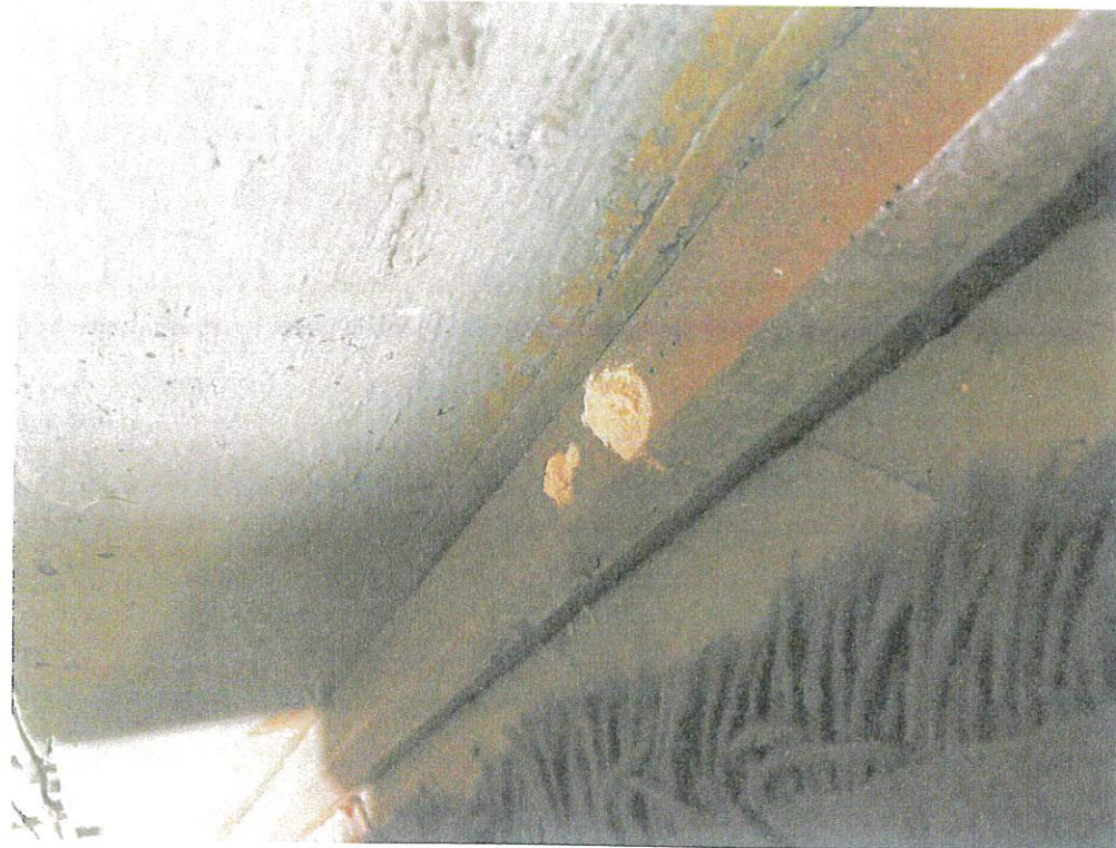
Fot. 3. Kałów, woj. łódzkie. Kościół pw. św. Mikołaja Biskupa i św. Stanisława Biskupa.. Widoczny pył drzewny świadczący o obecności drewnojadów.