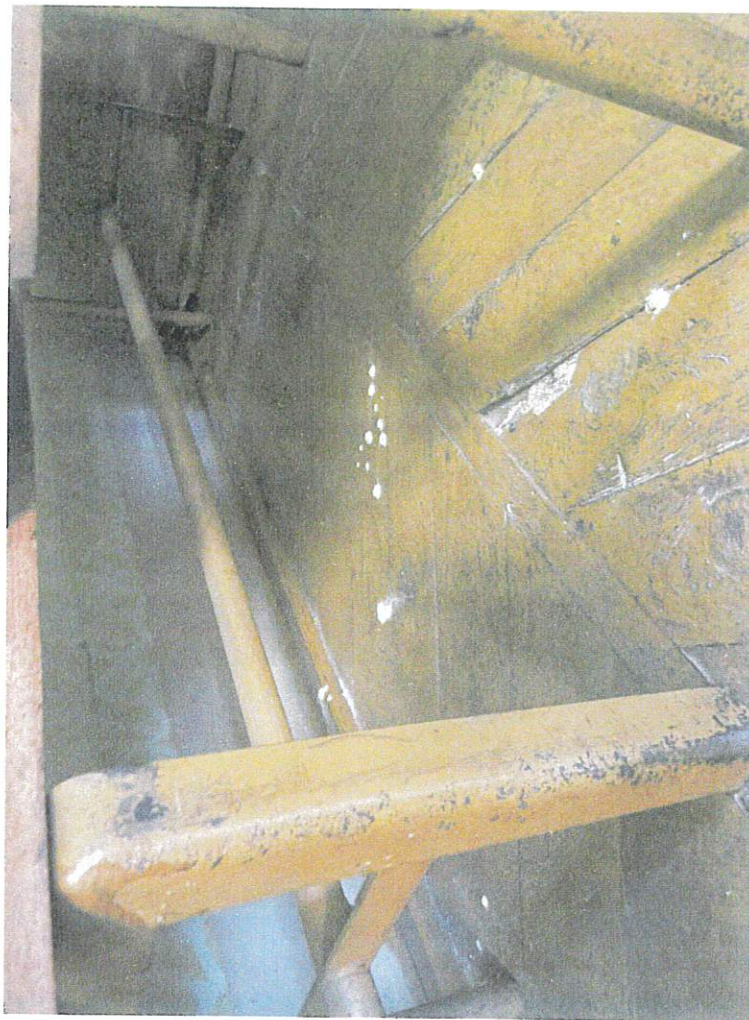
Fot. 5. Katow, woj. łódzkie. Kościół pw. św. Mikołaja Biskupa i św. Stanisława Biskupa. Widoczny pył drzewny świadczący o obecności drewnojadów.