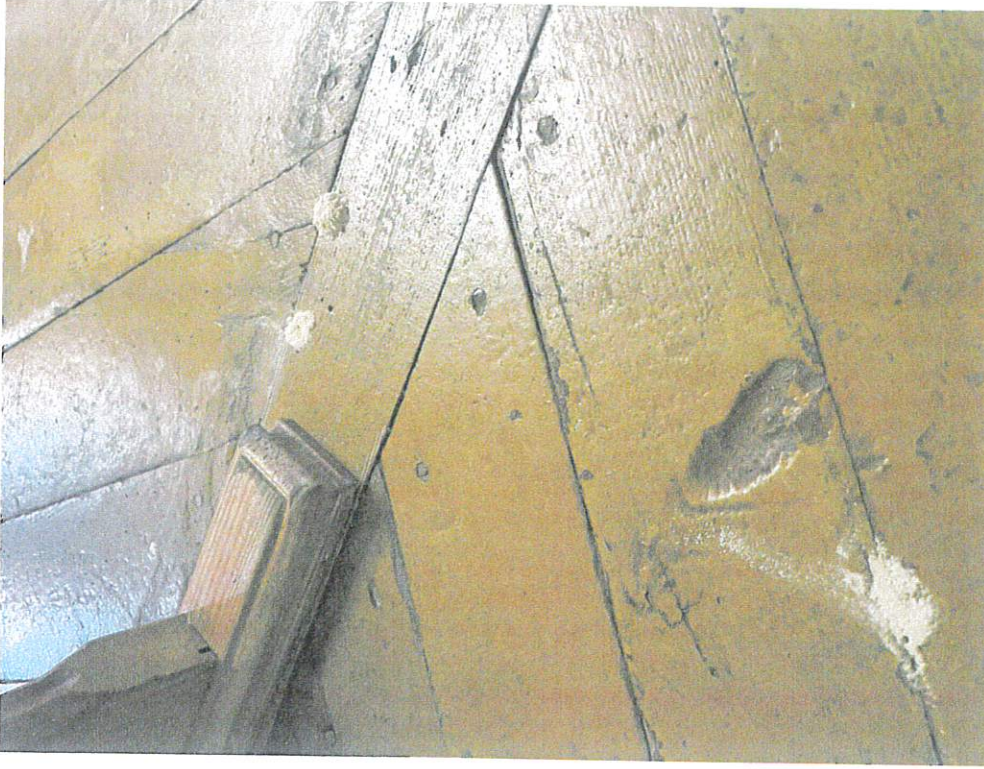
Fot. 7. Kałów, woj. łódzkie. Kościół pw. św. Mikołaja Biskupa i św. Stanisława Biskupa. Widoczny pył drzewny świadczący o obecności drewnojadów.